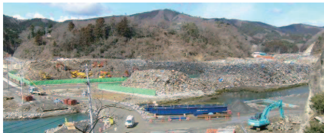
宮城県女川町一次仮置場 処理完了前 (平成24年3月13日)

しました。この間における放射線物質濃度等の測定結果は、災害廃棄物の受け入れ前後で変化はありませんでした。