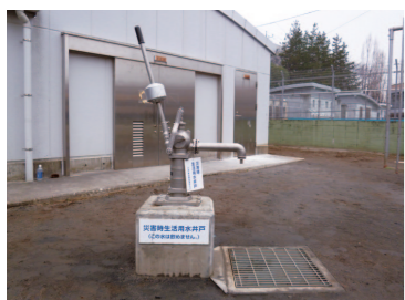
災害時生活用水井戸 (平尾小)