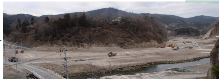
処理完了後 (平成25年3月27日)